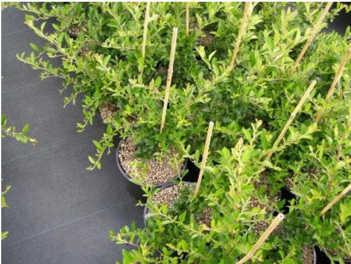
Figuur 3; Geen extra werk bij intern transport of afleveren

Het aanbrengen gaat erg eenvoudig. Met de gangbare afdekstrooiers kunt u Jaritop® eenvoudig aanbrengen. Extra handelingen zijn niet noodzakelijk. U hoeft tijdens en/of aan het einde van de teelt geen mos en/of onkruid te verwijderen van uw potten. Hiermee bespaart u veel arbeid en tijd. U zult schrikken als u erachter komt wat het werkelijk kost, aan tijd en geld, om tijdens de teelt of bij het afleveren extra personeel in te moeten zetten om het aanwezige onkruid te verwijderen. Met Jaritop® heeft u deze kosten niet meer!