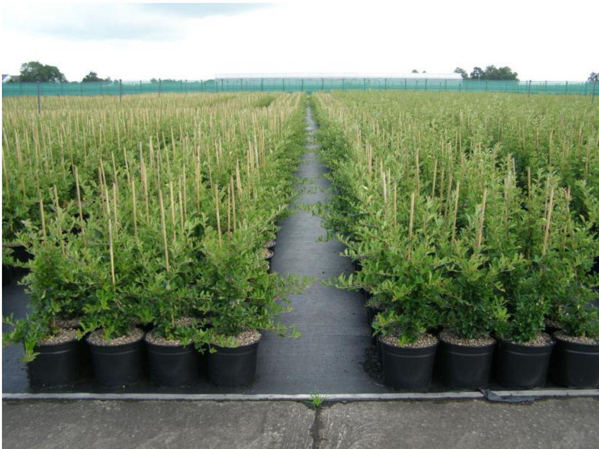
Figuur 2; Geen onkruid verwijderen is gemakkelijk werken

Voor u draait het maar om een ding, u wilt gewoon de beste afdeklag die er is. U wilt absoluut voorkomen dat u bij het afleveren of tijdens de teelt een hoeveelheid mos en/of onkruid moet weghalen van de bovenlaag van uw pot.