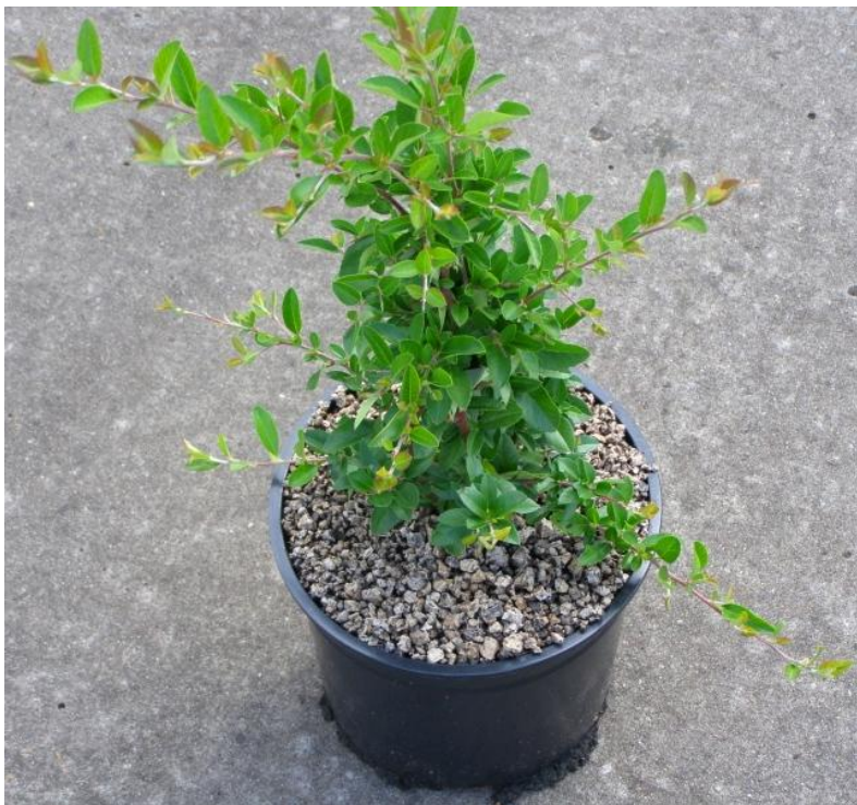
Figuur 1; Een pot met Jaritop®

Jaritop® is een nieuwe afdeklag voor uw pot.